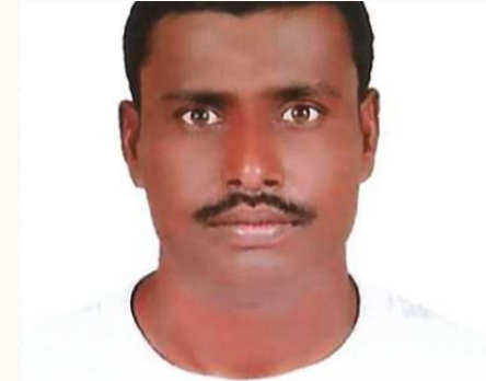
JOSEPH Procurement Dept: