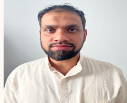
ASEES Public Relation Officer