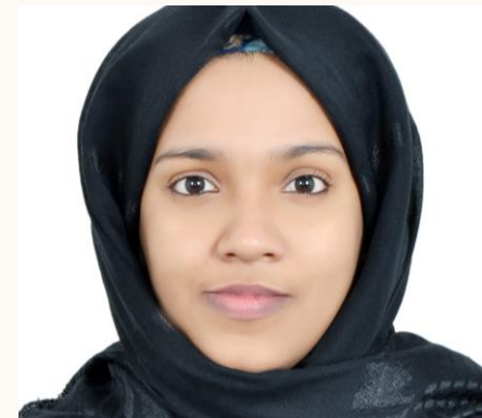
SHAMSEERA Document Controller