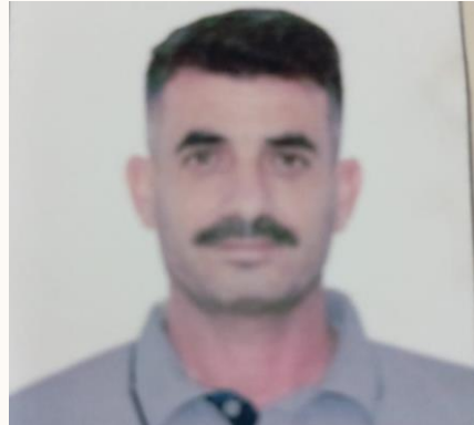
FAHED Site Engineer